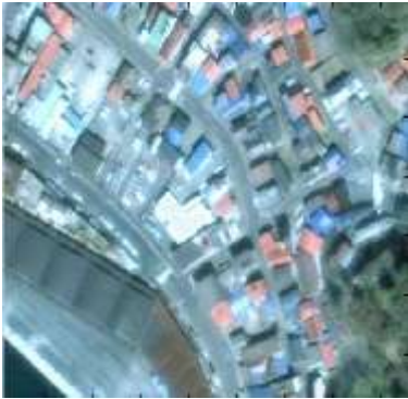
配准的汶川地震前图像