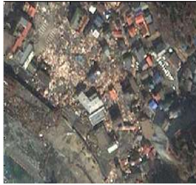
配准的汶川地震后图像